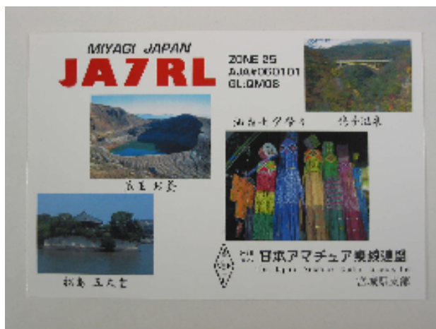
< J A R L 宮城県支部交信証 >