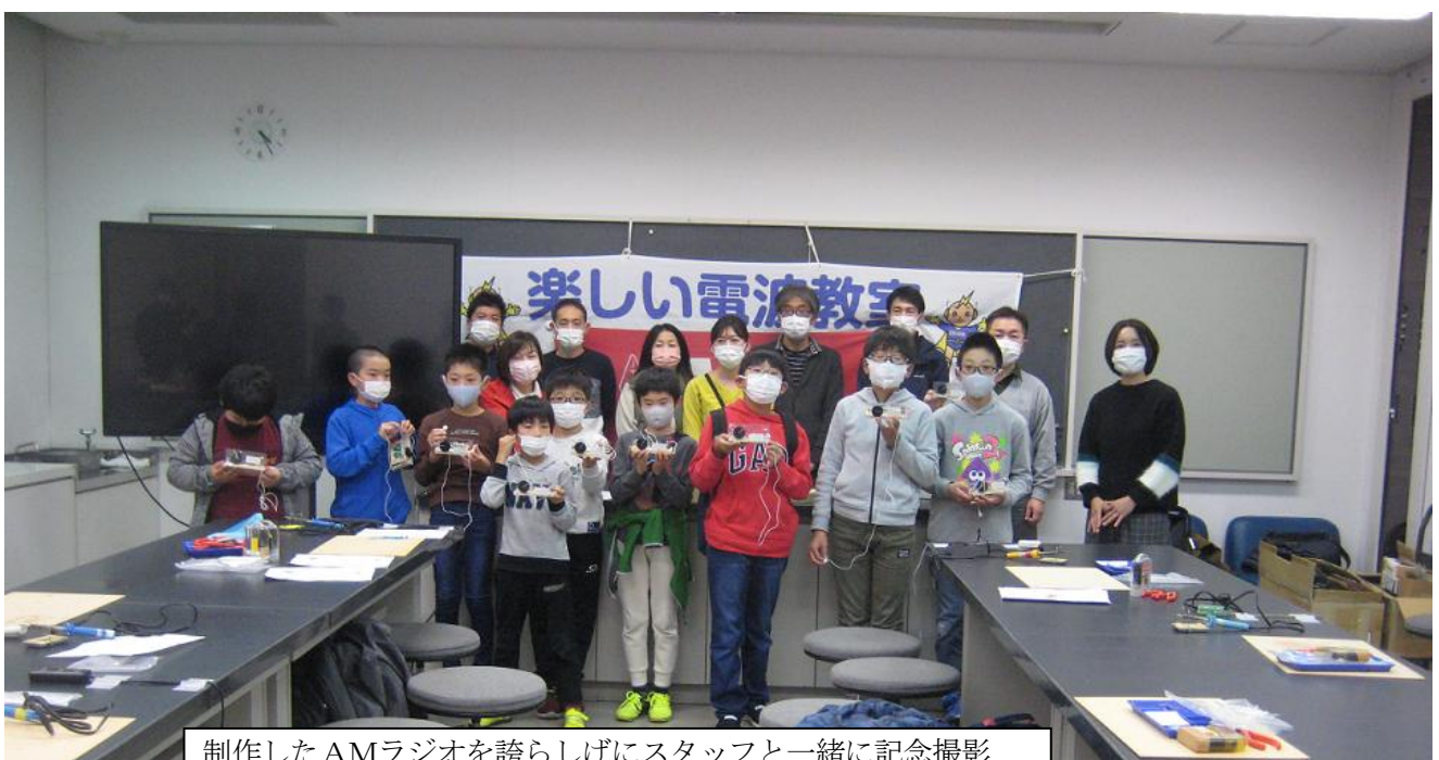
制作したAMラジオを誇らしげにスタッフと一緒に記念撮影

KT-16DXは、受信感度が向上し前面にアクリルの周波数板と木製のプリント基盤用台が付き、一寸デラックスなタイプです。